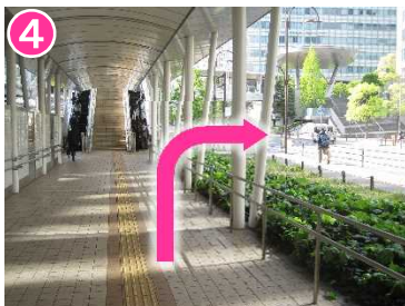
上り階段の手前を右へ曲がり、 横断歩道を渡る