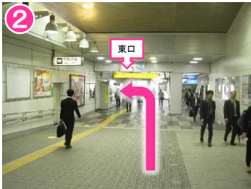
突き当たりを、左へ曲がる