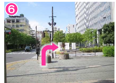
1つ目の信号を渡ったビルの 1階が容器文化ミュージアムです