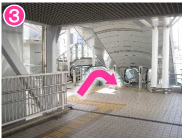
曲がった先の階段を下りる