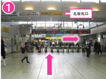
北改札口を出て、右へ進む (東口方向)