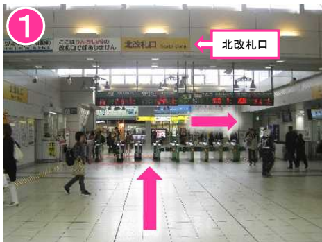
北改札口を出て、右へ進む (東口方向)