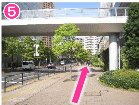
4~5分まっすぐ進む * 途中、目黒川(御成橋)を渡る