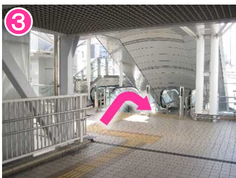
曲がった先の階段を下りる