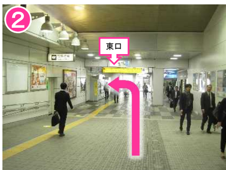
突き当たりを、左へ曲がる