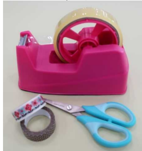
マスキングテープ はさみ (セロテープだけでもいい)